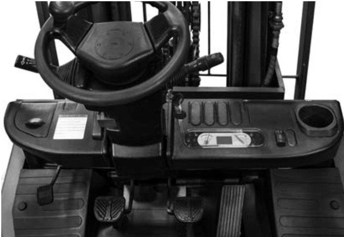
Ampio posto guida