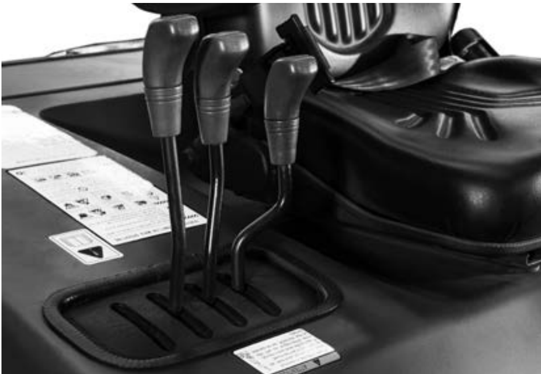
Comandi idraulici ergonomici