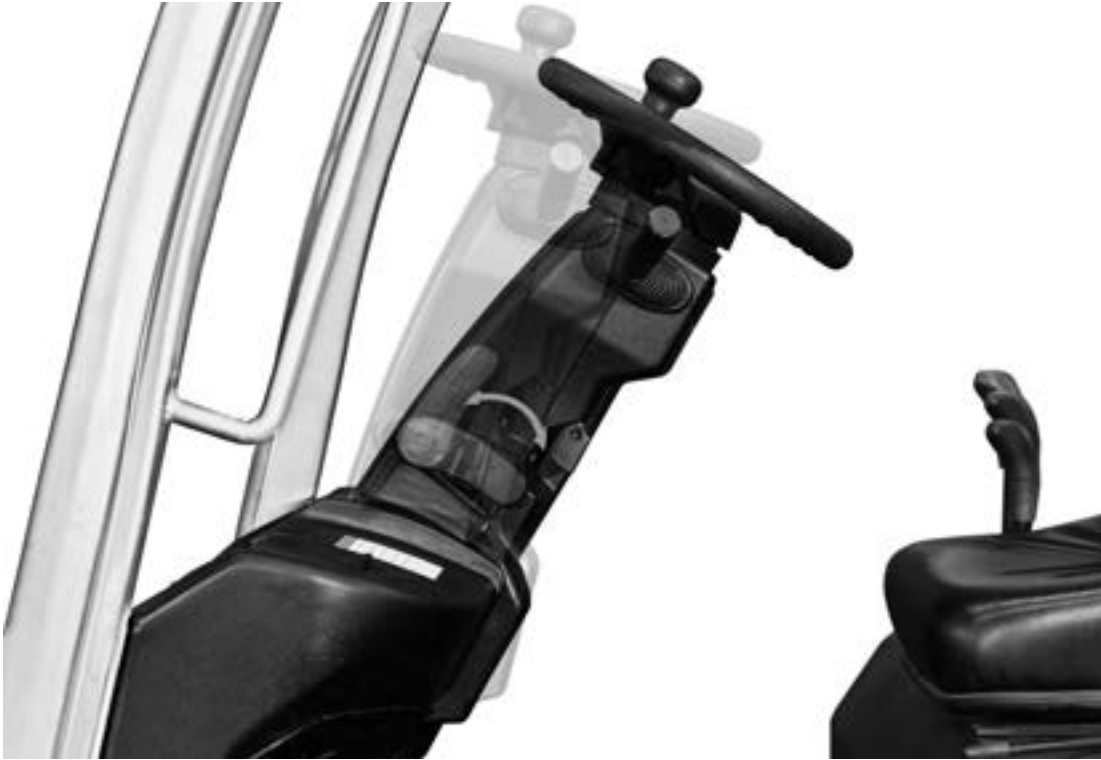
Piantone dello sterzo regolabile