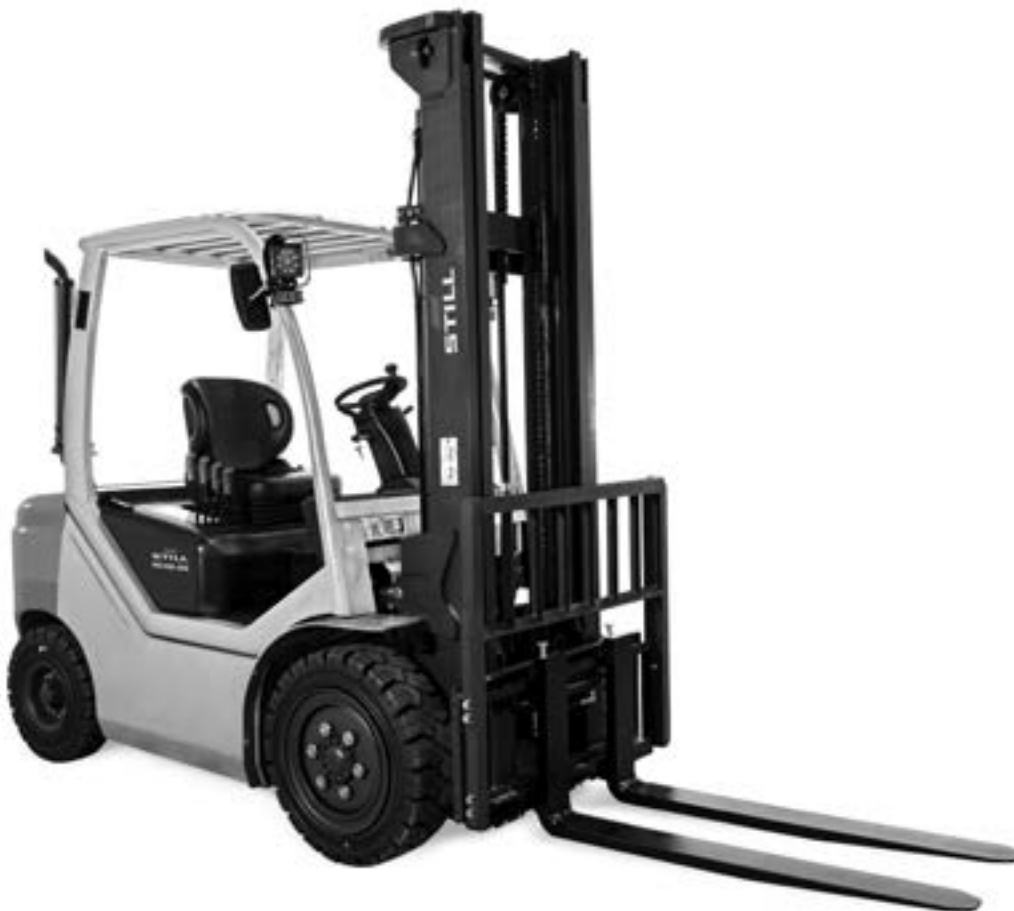
Completa dotazione di base